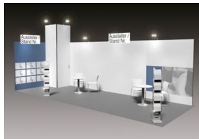
ALL-IN PLUS GEEIGNET FÜR 24 – 47 m 2